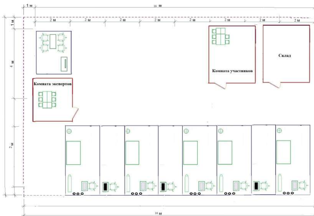
Схема застройки площадки компетенции "Технологии моды"